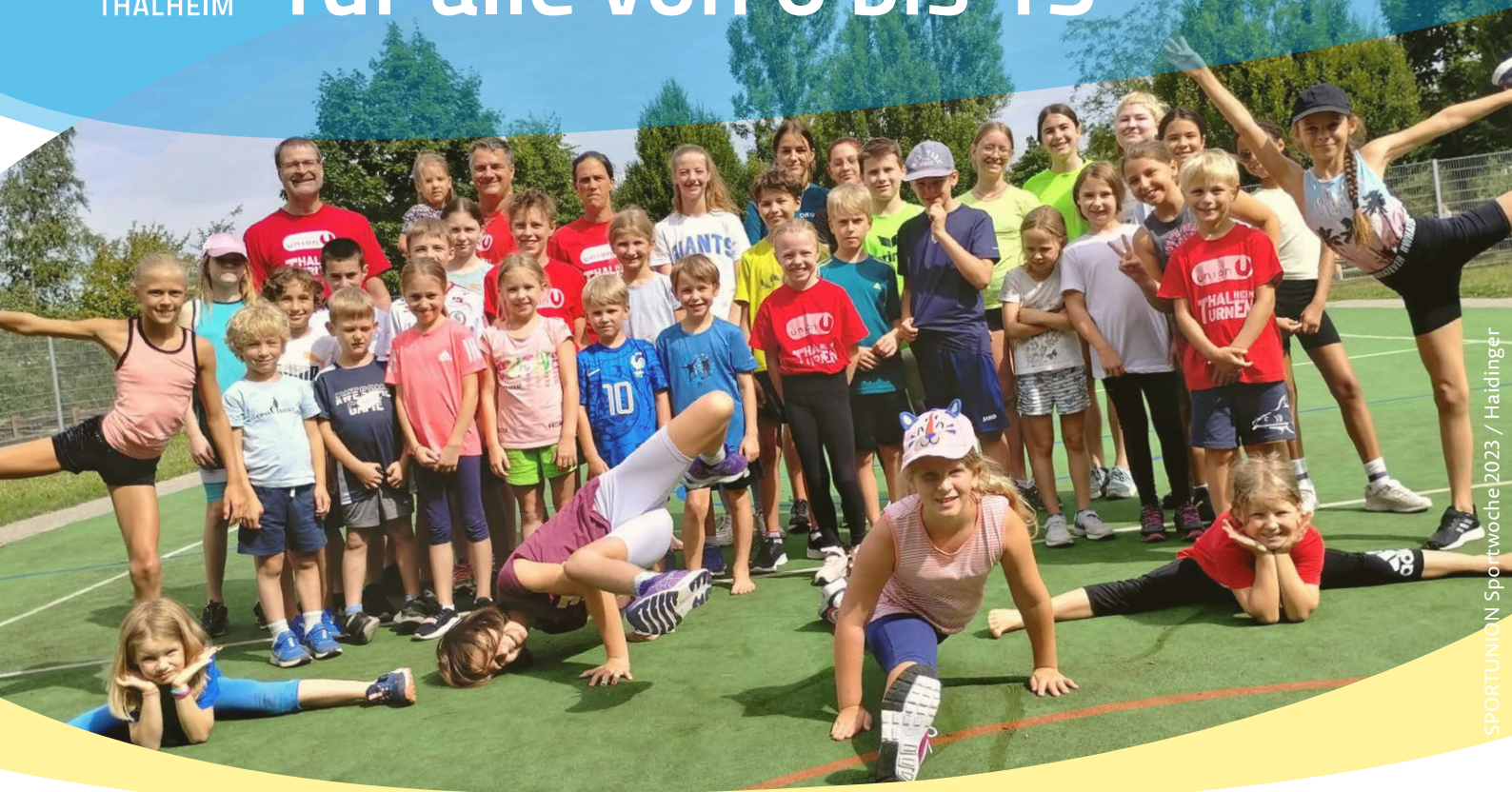
SPORTUNION Sportwoche 2023